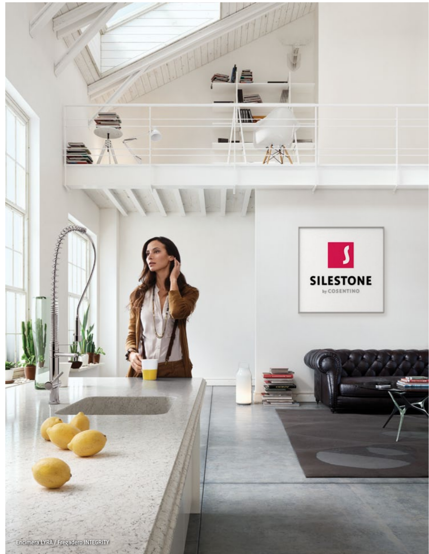
Encimera LYRA / Fregadero INTEGRITY