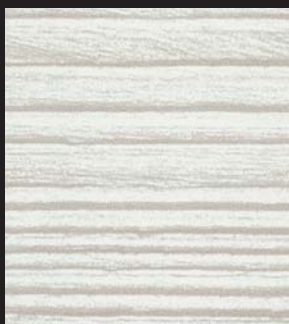
PM - 001 - SY