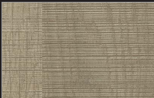
FPP - 002 - TY