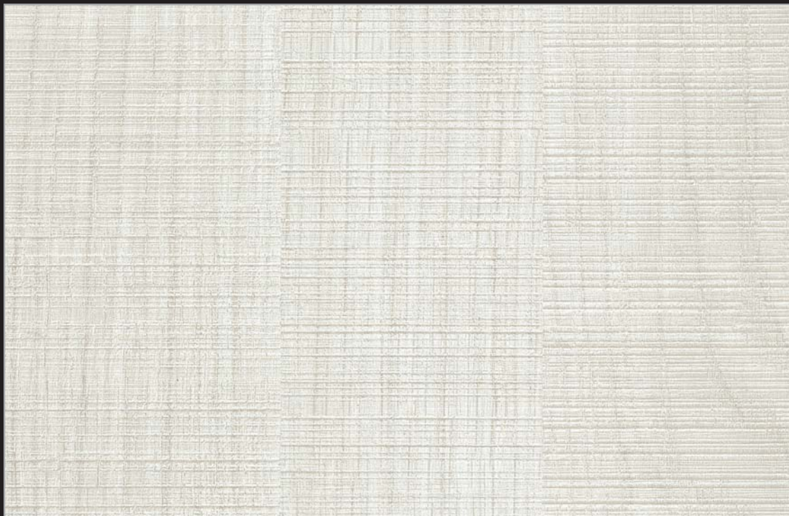
FPP - 001 - TY