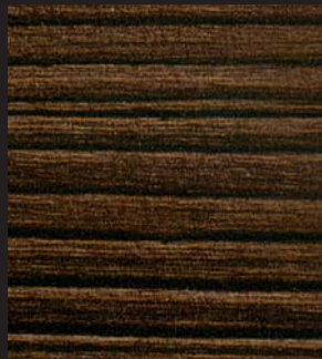
PM - 003 - SY