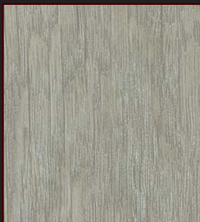
MU - 001 - URB