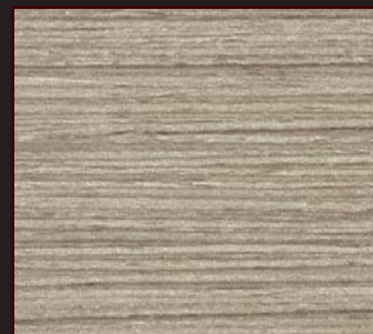
WALABA - 02 - SY