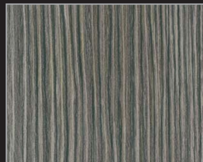
RT - IDA - 04