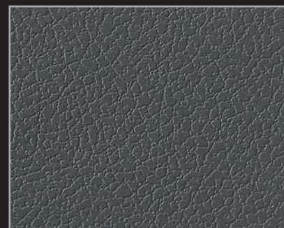
Leather dark grey