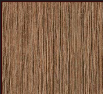
PR - 804 - SY