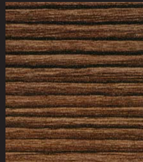
PM - 004 - SY