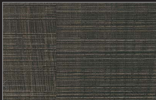
FPP - 003 - TY