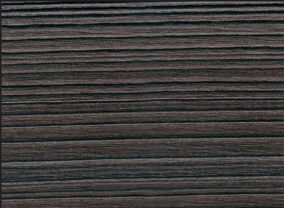
PM - 002 - SY