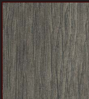
MU - 003 - URB