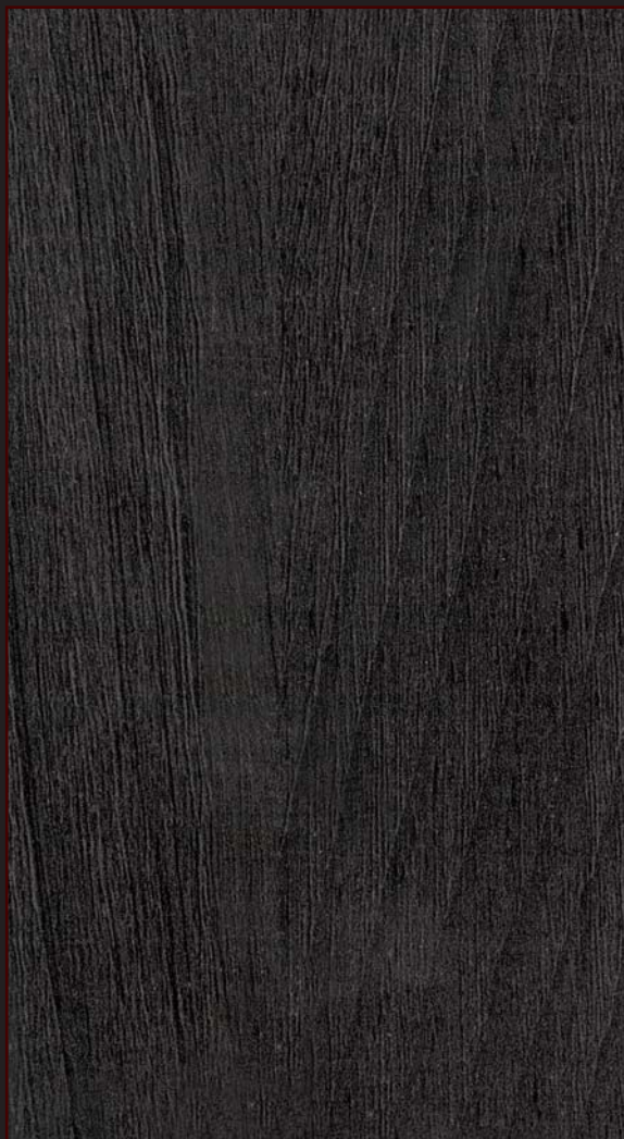
PR - 801 - SY