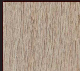
PR - 803 - SY