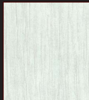
MU - 004 - URB