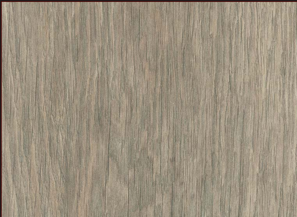
MU - 002 - URB