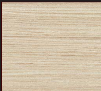
WALABA - 01 - SY