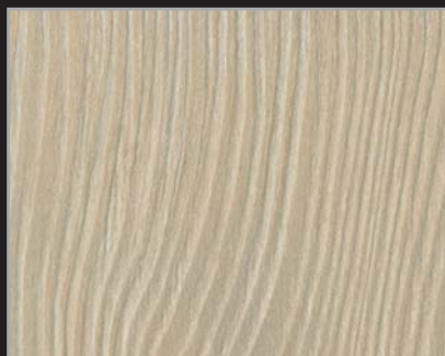
RT - IDA - 02