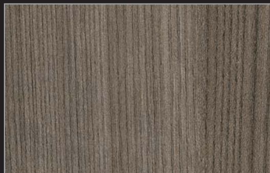
OLM - 002 - MR