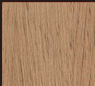
PR - 802 - SY