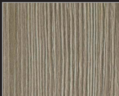
RT - IDA - 03