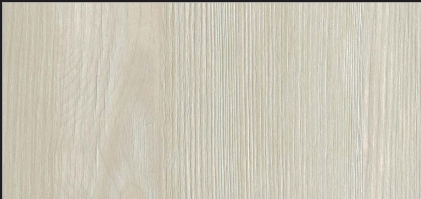
RT - IDA - 01